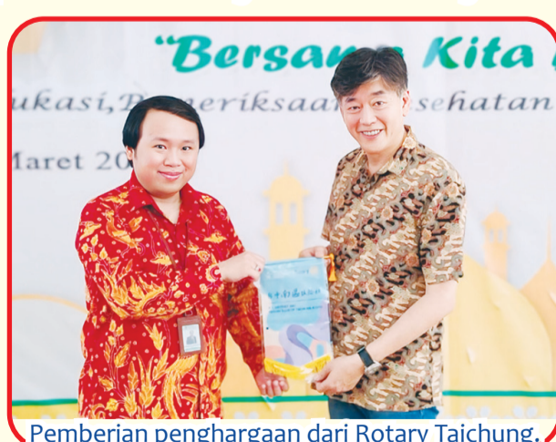
Pemberian penghargaan dari Rotary Taichung.

"Kami ingin mengajak masyarakat, khususnya warga kurang mampu dan kaum duafa, untuk