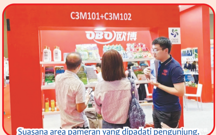
Suasana area pameran yang dipadati pengunjung.