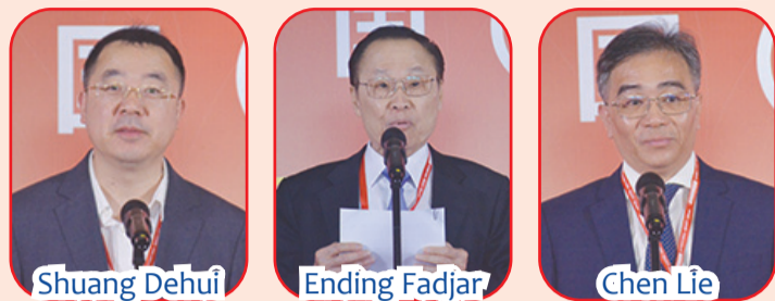
JAKARTA (IM) - Meorient Exhibition International kembali menggelar secara serentak tiga pameran dagang skala internasional yaitu Building & Decoration Expo (BDEXpo), Appliances