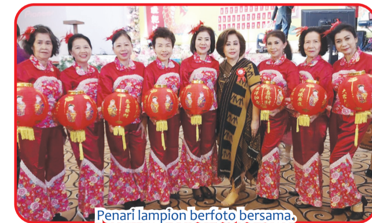
Penari lampion berfoto bersama.