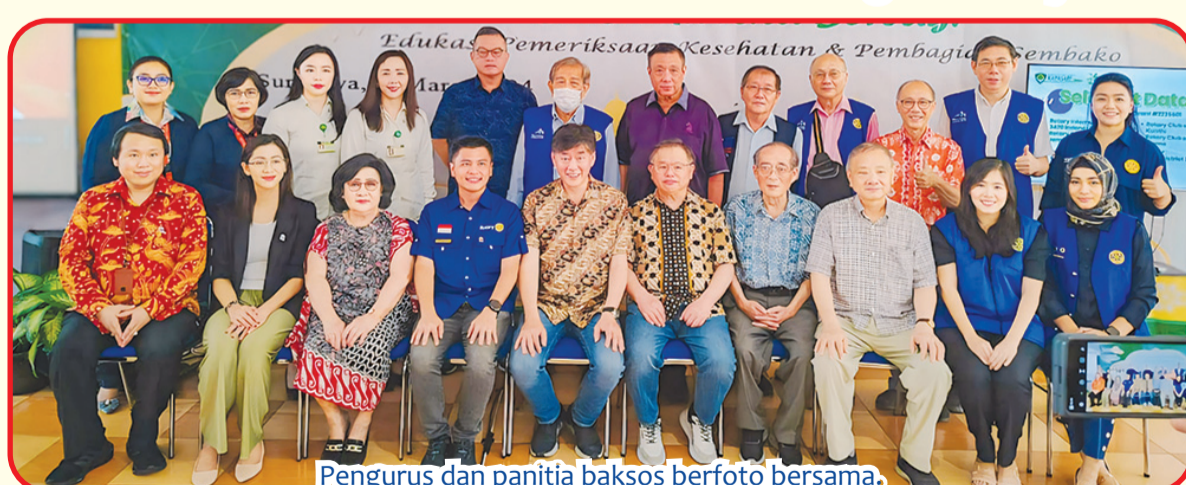
Pengurus dan panitia baksos berfoto bersama.

but, Rotary International District 3420 Indonesia, Rotary Club of Taichung South District 3461, Rotary Club of Jembatan Merah, Rotary Club of Semarang Kunthi, Rotary Club of Surabaya Darmo, perwakilan PT Santos Jaya Abadi, pengurus Perkumpulan Adi Husada, pengurus STIKes Adi Husada, jajaran Direksi RSAHK, dan warga penerima bantuan. • anto tze