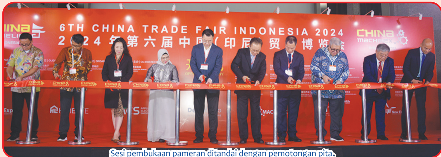
Sesi pembukaan pameran ditandai dengan pemotongan pita.